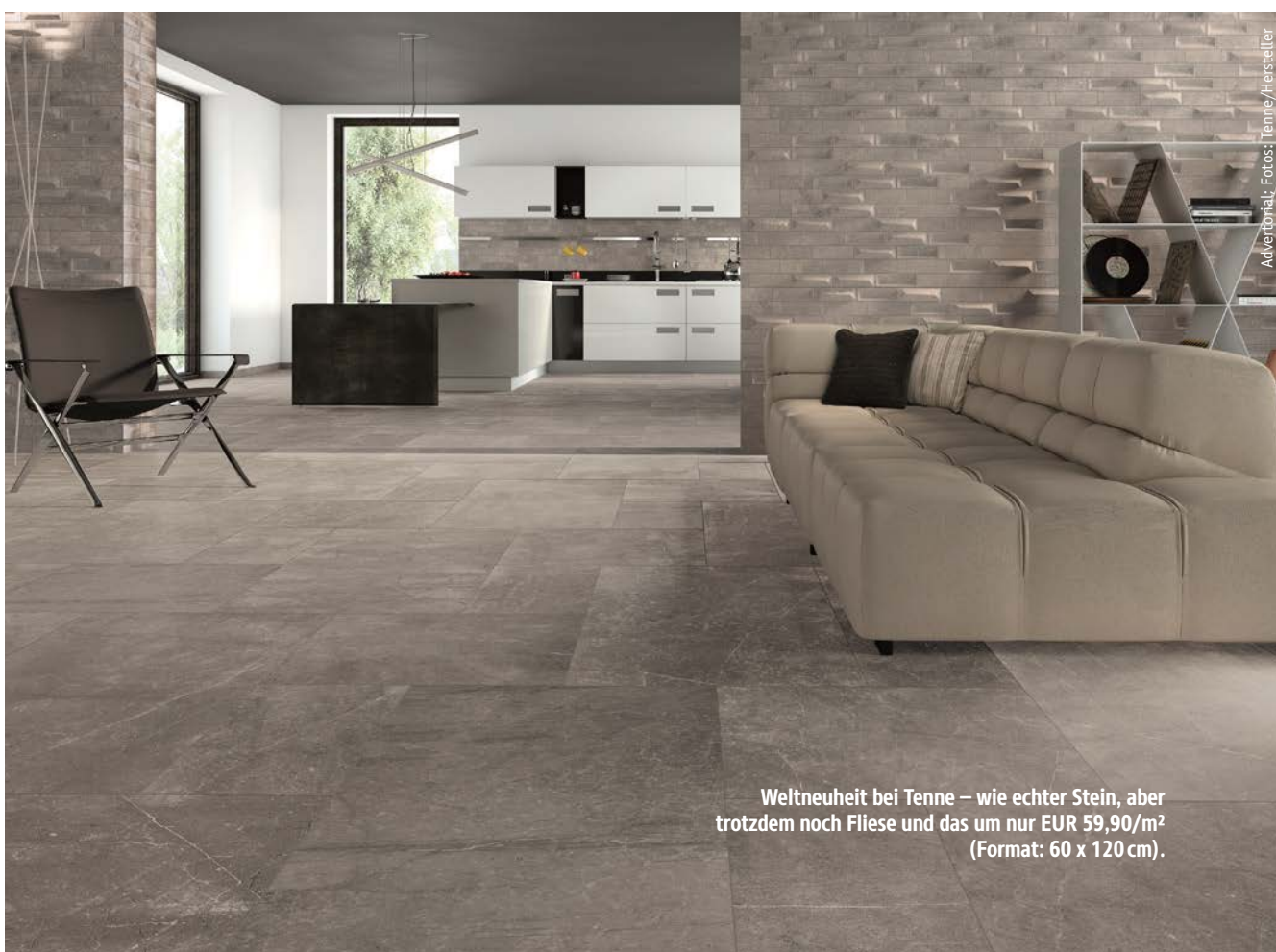
Weltneuheit bei Tenne – wie echter Stein, aber trotzdem noch Fliese und das um nur EUR 59,90/m 2 (Format: 60 x 120 cm).

Tenne Leibnitz Kindermann Bad & Heiztechnik Dechant Thaller Straße 37, 8430 Leibnitz 03452 707 65 tenne@kindermann.st