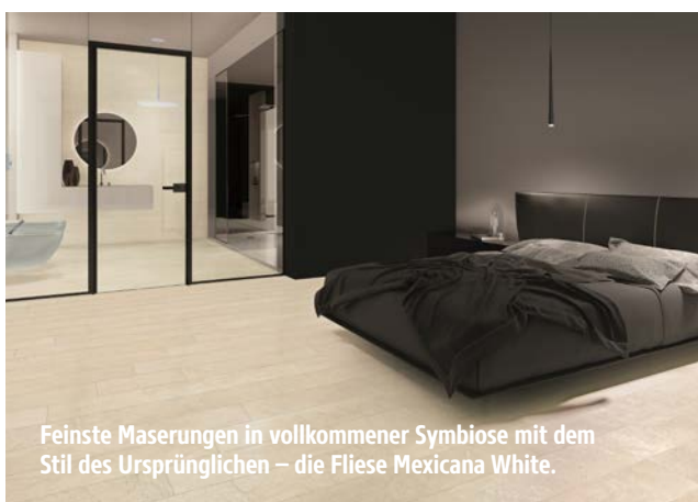
Feinste Maserungen in vollkommener Symbiose mit dem Stil des Ursprünglichen – die Fliese Mexicana White.