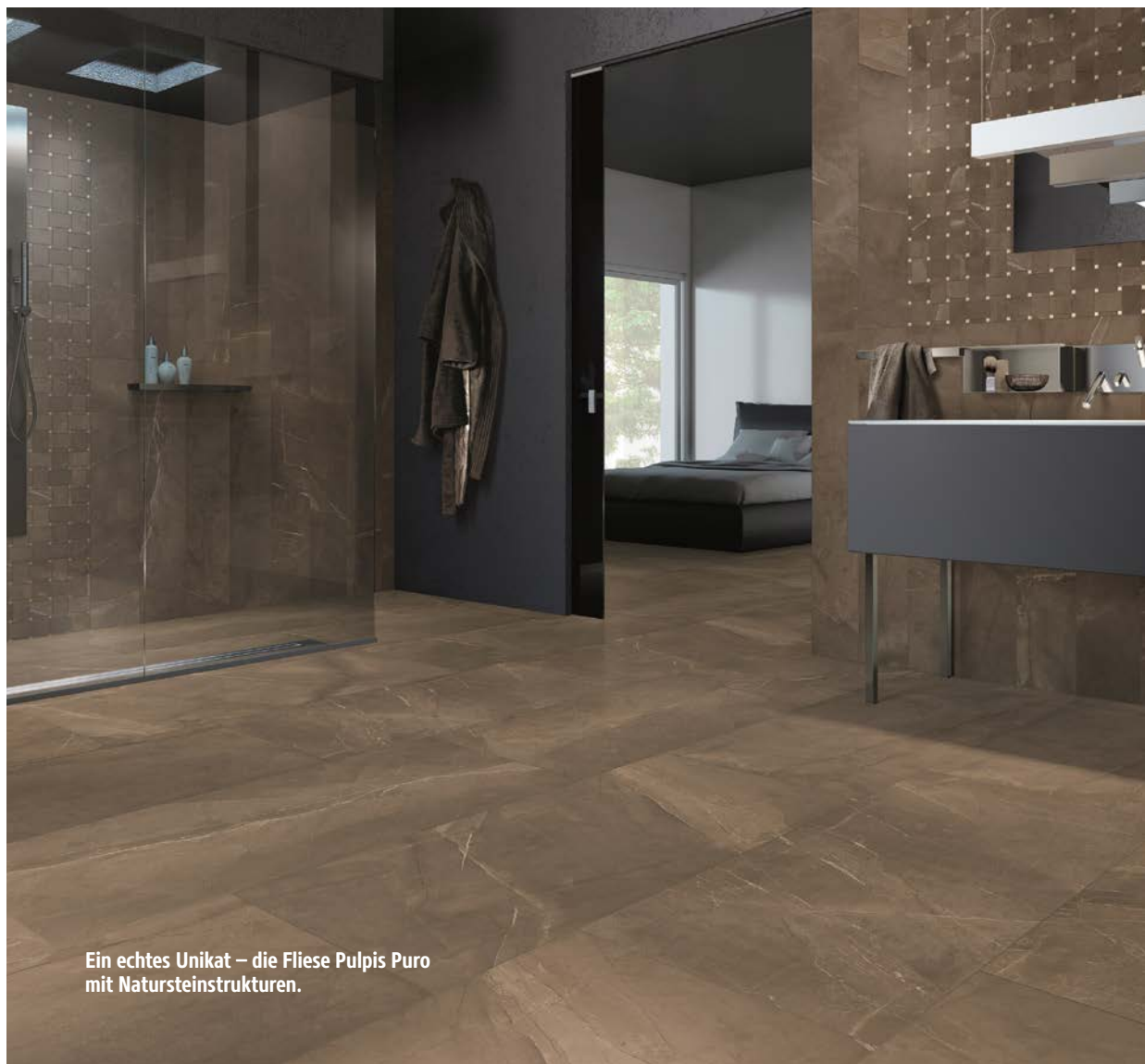
Ein echtes Unikat – die Fliese Pulpis Puro mit Natursteinstrukturen.

Unter dem Motto „Wohn(t)raum Bad“ ist Tenne seit mehr als 40 Jahren der Garant, echte Traumbäder durch Direktimporte erschwinglich zu machen. Mediterranes Design bei der Badeinrichtung und bei Fliesen wird hier zu vernünftigen Preisen auf den Markt gebracht. Nun trumpft der Badezimmerprofi mit einer absoluten Weltneuheit auf – den einzigartigen Fliesenserien Pulpis & Mexicana im Naturstein-Look!