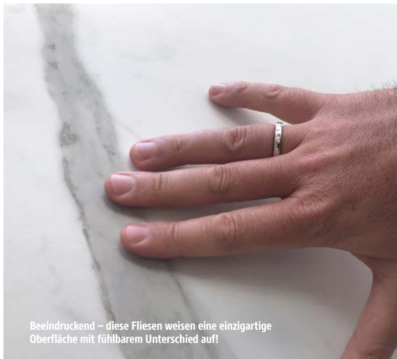
Beeindruckend – diese Fliesen weisen eine einzigartige Oberfläche mit fühlbarem Unterschied auf!