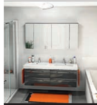
Badmöbel Balto (li.) und Dampfdusche Theon (re.) von Tenne.